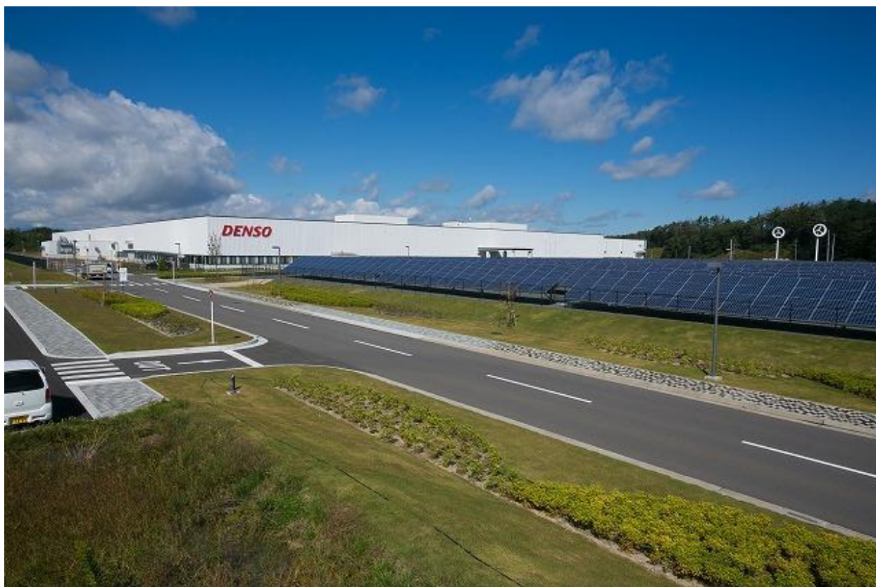
株式会社デンソー福島（福島県田村市）