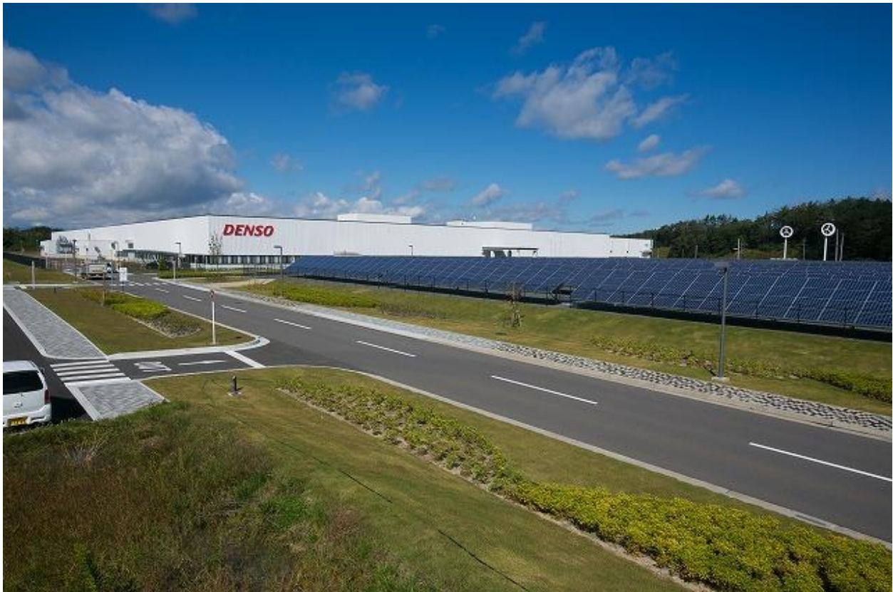
株式会社デンソー福島（福島県田村市）